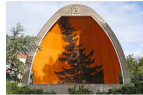
Sens figurés , Charles Belle

Photographies de Marianne Mispelaëre, Silent Slogan , 2016; Peintures-affiches de Joël Auxenfans; affiches de Laurent Lacotte et de Rester. Étranger; photographies de Gérard Aimé et Jean Pottier.