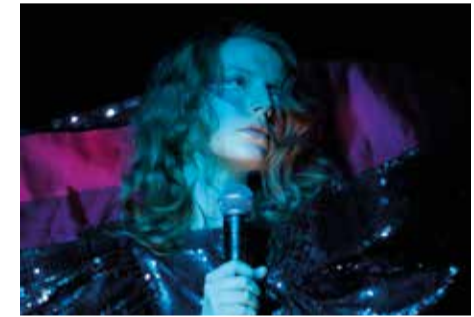
Alice Daquet

1968 des méta morphoses à l'œuvre 2018 26.05.2018