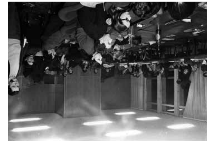
Occupation de la salle du Conseil de l'Université Paris-X, 22 mars 1968. Nanterre.

NOUS PASSAIS DE L'ÉPONGE À DE PROFONDS TOURNENTS CHRONAL MÉTAPHYSIQUE CRÉATION DU BIEL MERN Les Films du monde, 19 cinétracts, 53 min. Production Les Films du Zigzag, mai 2016 Frank Smith.